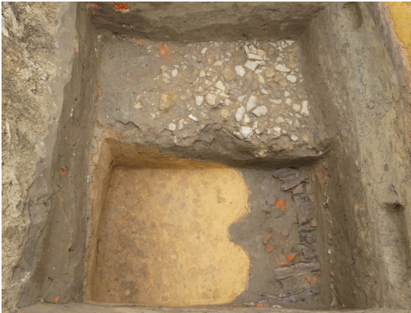
Zicht op enkele voorgangers van de huidige hoofdrijweg. Bovenaan een kasseiweg uit de 17de-18de eeuw en onderaan een ouder wegniveau op houten liggers en bakstenen, aangelegd in de opgevlude “holle weg”.

Vooraf uit de Romeinse periode kennen we een aantal sites in de omgeving van Mater. Dit hoeft niet te verbazen gezien de belangrijke Romeinse weg van Hofstade (Zemst) over Velzeke (Zottegem) naar Kortrijk ook over Mater liep. Deze is ca. 600 m ten noordwesten van het Materplein te situeren. Tijdens het proefputtenonderzoek zijn ten oosten van de kerk, onder de straat, verschillende voorlopers van de huidige wegenis teruggevonden, waaronder een kasseiweg uit de 17de of 18de eeuw en een nog ouder wegniveau op houten liggers. Het alleroudste wegniveau was echter onverhard waardoor een zogenaamde ‘holle weg’ ontstond. Ze kan voorlopig niet gedateerd worden. Het behoort tot één van de mogelijkheden dat deze ‘holle weg’ het overblijfsel is van een secundaire weg uit de Romeinse periode, verbonden met de hoofdweg Hofstade-Velzeke-Kortrijk.