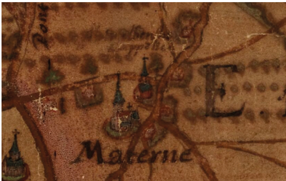
Snede uit de Horenbaultkaart (1596) t.h.v. Mater. De kleine kerk bovenaan is de eerste Sint-Martinuskerk, te situeren waar thans de Sint-Amelbergakapel staat. Langs de kerken loopt een voorganger van de huidige hoofdrijweg.

Ook het kerkhof is door de eeuwen heen verschillende malen aangepast. Het eerste kerkhof zal zich rond de eerste Sint-Martinuskerk bevonden hebben. Met de bouw van de tweede kerk zal het kerkhof mee verhuisd zijn. Sinds 1954 worden de inwoners van Mater opnieuw begraven op een nieuw kerkhof aan de Sint-Amelbergakapel. Ten noorden van de huidige kerk is een graf aangetroffen dat ten laatste in de 16de eeuw te dateren is. Dit toont aan dat er hier nog restanten van het kerkhof rond de tweede of misschien zelfs de eerste Sint-Martinuskerk aanwezig zijn. Ook op de westelijke helft van het Materplein zijn graven aangetroffen. Deze zijn wellicht allen in de 18de tot 20ste eeuw te dateren en zullen dus meestal te linken zijn aan de huidige kerk. Enkele graven bevinden zich dicht bij de huidige schoolpoort, buiten elke gekende begrenzing van het kerkhof. Mogelijk is er een fout aanwezig in de historisch-cartografische bronnen. Anderzijds zou het ook kunnen gaan om protestantse graven. Er was immers in Mater een relatief grote hoeveelheid protestanten aanwezig, in het bijzonder in de 16de en 17de eeuw na de beeldenstorm van 1566. Mogelijk mochten/wilden zij niet op het katholieke kerkhof begraven worden.