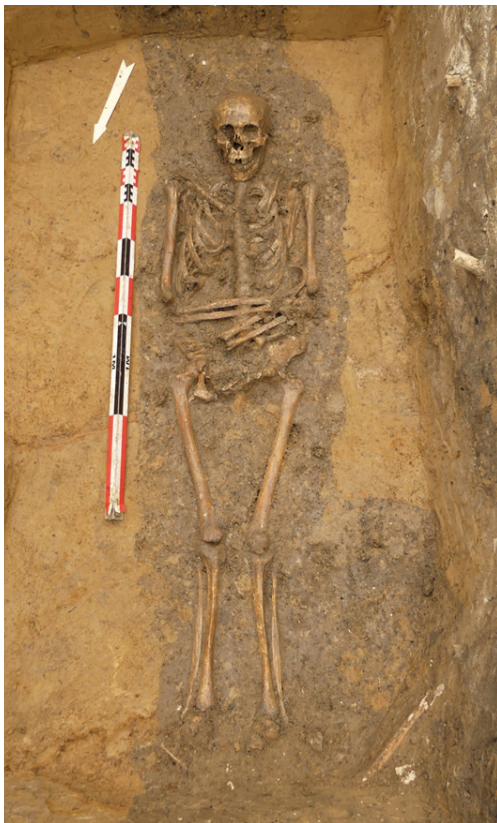
Het graf van een al iets oudere man. Deze stoffelijke resten en degene die bij de opgraving zullen aangetroffen worden, zullen verder onderzocht worden op leeftijd, geslacht, lichaamslengte, eventuele ziektes en/of voedingspatronen.