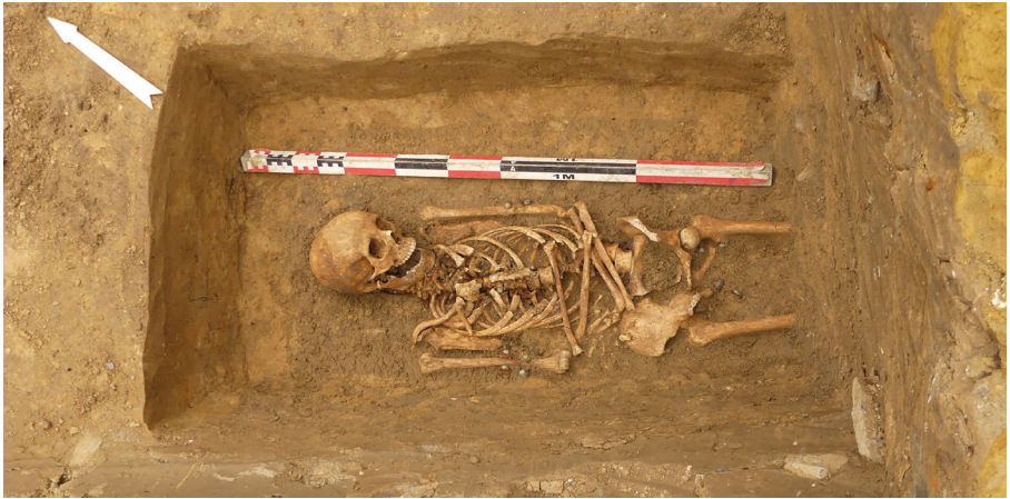
Het graf van een jonge vrouw tussen 18 en 23 jaar. Het bevindt zich voor de huidige schoolingang, buiten enige gekende grenzen van het vroegere kerkhof.