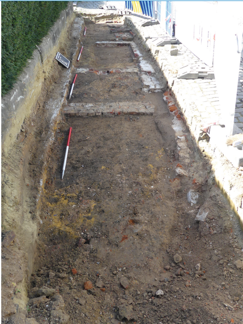
Een vlakregistratie van de fundamenteën van het voormalige “Gemeentehuis” tegenover het huidige café “In’t Stadhuis”.

Tot slot zijn er tijdens het vooronderzoek ook verschillende restanten van bakstenen muren en gebouwen aangetroffen ten noorden van de kerk. Het gaat onder meer om de kerkhofmuur van een vroegere fase van het kerkhof. Deze sluit aan op de funderingen van een vleugel van het zogenaamde ‘Gemeentehuis’. De kerkhofmuur en het gebouw zijn in 1966 afgebroken. Uit historische en historisch-cartografische bronnen weten we dat het ‘Gemeentehuis’ minstens uit de 18de eeuw dateert. Het archeologisch vondstmateriaal bevestigt dit.