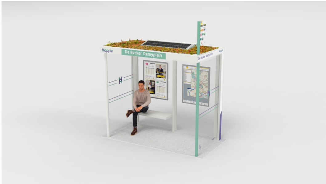
Schuilhuisje met glazen wanden, groendak en zonnecel voor verlichting.