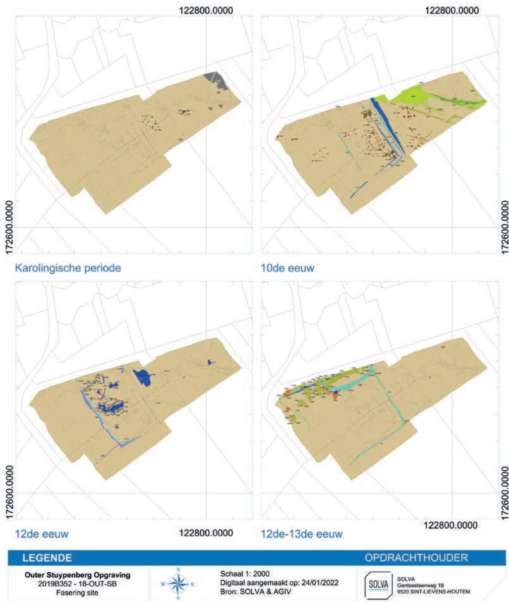
Fig. 1 Gefaseerd grondplan van de site Outer Stuypenberg.

De stad Ninove wenste een nieuw hockeyveld met clubhuis en een gebied voor dagrecreatie met landschappelijke waarde aan te leggen aan de Stuypenberg te Outer (Ninove). Voorafgaand aan de werken is door SOLVA op 8205 m 2 een vlakdekkende opgraving uitgevoerd. De site heeft sporen opgeleverd van de Karolingische periode tot de 18de eeuw. In de 10de eeuw wordt een omgrachting aangelegd die meer dan twee eeuwen de basis zal vormen in de organisatie van de bewoning (Fig. 1).