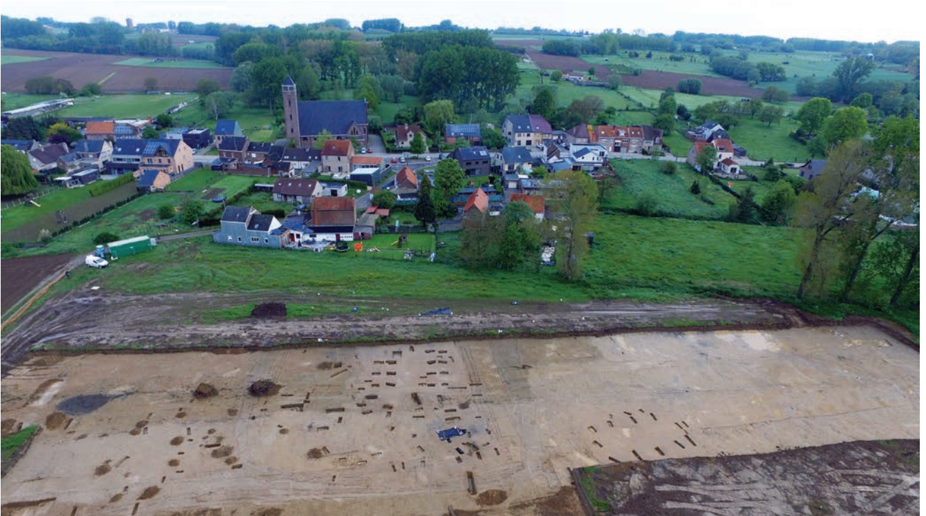
Fig. 2 Luchtfoto van de opgraving met op de voorgrond een deel van het enclosure en op de achtergrond het gehucht Lebeke.

Er is een inhumatiegraf aangetroffen van een volwassene met aan het hoofdeinde een neonaat, bijgezet in een apart kistje. In dezelfde kuil, maar wellicht op een later tijdstip, is een jongvolwassene bijgezet. Van de skeletten restte, met uitzondering van de tanden, alleen nog een lijksilhouet. De context is gedateerd met een radiokoolstofdatering op houtskool uit de grafvulling. Het resultaat, tussen 670-830 calAD (95,5%, RICH-29459: 1264 ± 22 BP), is als terminus post quem voor de context te beschouwen. De oriëntatie van de graven is W-O, met het hoofd in het westen conform de christelijke traditie. Op korte afstand is een andere kuil aangetroffen met menselijke tanden en enkele beensplinters. De kuil is echter te klein om een persoon in te begraven. Uit dezelfde periode dateert eveneens de begraving van een rund.