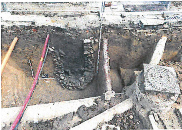
Fig. 4: Kalkzandstenen waterput aan de rand van het kerkhofareaal

De paalkuilen rond de kerk kunnen op basis van de ligging, oriëntatie en aard van de vulling niet tot dezelfde gebouwplattegrond behoord hebben. Zeven paalkuilen zijn ter hoogte van de noordwestelijke kerkhoftoegang te situeren. Het is mogelijk dat sommige van deze paalkuilen in verband kunnen gebracht worden met de palenrij die werd aangetroffen in 2007, doch een gebouwplattegrond kon niet gereconstrueerd worden. De weinige dateerbare contexten lijken de vullingen van deze paalkuilen te plaatsen ten vroegste in de 10e eeuw. Opmerkelijk hierbij is dat er vóór het oprichten van deze houtbouwconstructie op diezelfde plaats reeds een traditie van begraving bestond en dat deze traditie na de opgave van deze constructie gewoon werd voortgezet. De vraag kan dan ook gesteld worden of we hier niet te maken hebben met een oudere versie van de huidige kerk of een ander gebouw in de religieuze of funeraire traditie. Eveneens vermeldenswaardig is een rij van vier paalkuilen die voorlopig te dateren lijkt in de 12e tot de eerste helft van de 13e eeuw. Deze palenrij kan mogelijkerwijs toebehoord hebben aan een gebouw. De constatacie dat deze rij het tracé van de latere kerkhofmuur volgt, kan echter ook wijzen op een palissade die het kerkhofareaal omsloot en dit gelijktijdig of posterieur aan de recentste kerkhofgracht.