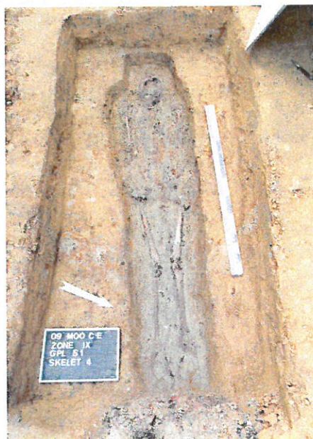
Fig. 2: Antropomorf graf bij opgraving

Bij het onderzoek in 2009-2010 werd een totaal van 101 skeletten geregistreerd, op te splitsen in een kleine groep van 32 oudere, middeleeuwse, begravingen en een grotere groep van 69 recentere, postmiddeleeuwse individuen. De middeleeuwse graven werden op drie plaatsen aangetroffen: rond de kapel (Fig. 1.5) en op twee plaatsen rond de kerk (Fig. 1.6). Hierbij kan een duidelijke scheiding tussen de begravingen rond de kapel enerzijds en deze rond de kerk anderzijds opgemerkt worden. Over een afstand van ruim 25 meter tussen de twee zones zijn er immers geen begravingen vastgesteld. De zichtbare dualiteit tussen kapel en kerk, die