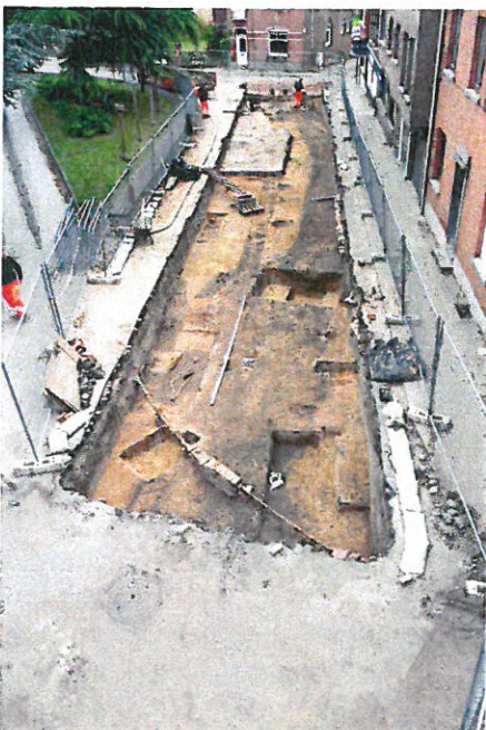
Fig. 3: De gracht het dichtst bij de kerk gelegen (1175-1200 AD)

De opgravingen in 1987 brachten twee grachten aan het licht die een cirkelvormig verloop rond de kerk suggereerden. Deze grachten werden bij het huidige onderzoek eveneens aangetroffen en meer naar het zuiden werd nog een derde gracht blootgelegd.